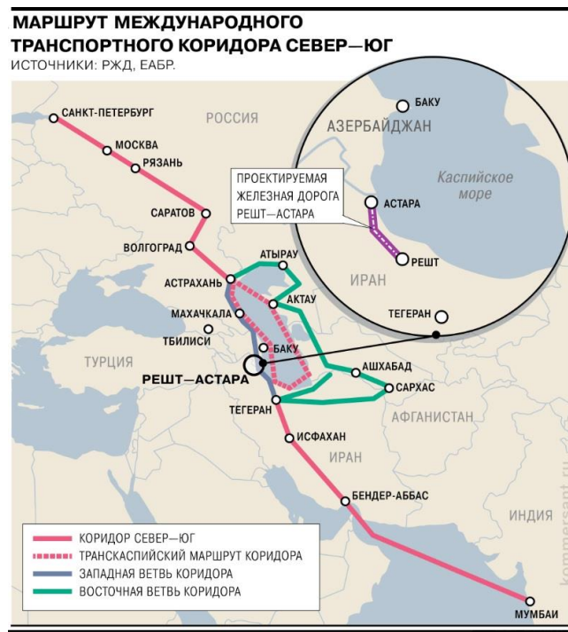
Рисунок 1. Маршрут МТК Север-Юг 298

Работают и МПК между странами. В случае с Азербайджаном это МПК по экономическому сотрудничеству. Кроме организации деловых форумов и контактов с представителями власти и бизнеса данных стран, большой акцент данная комиссия делает на развитии логистических связей. В частности, за 2023 год и 2024 год удалось добиться прогресса в облегчении логистики при пересечении границы 297 . Благодаря работе комиссии развивается и важный для российских товаров МТК «Север-Юг»