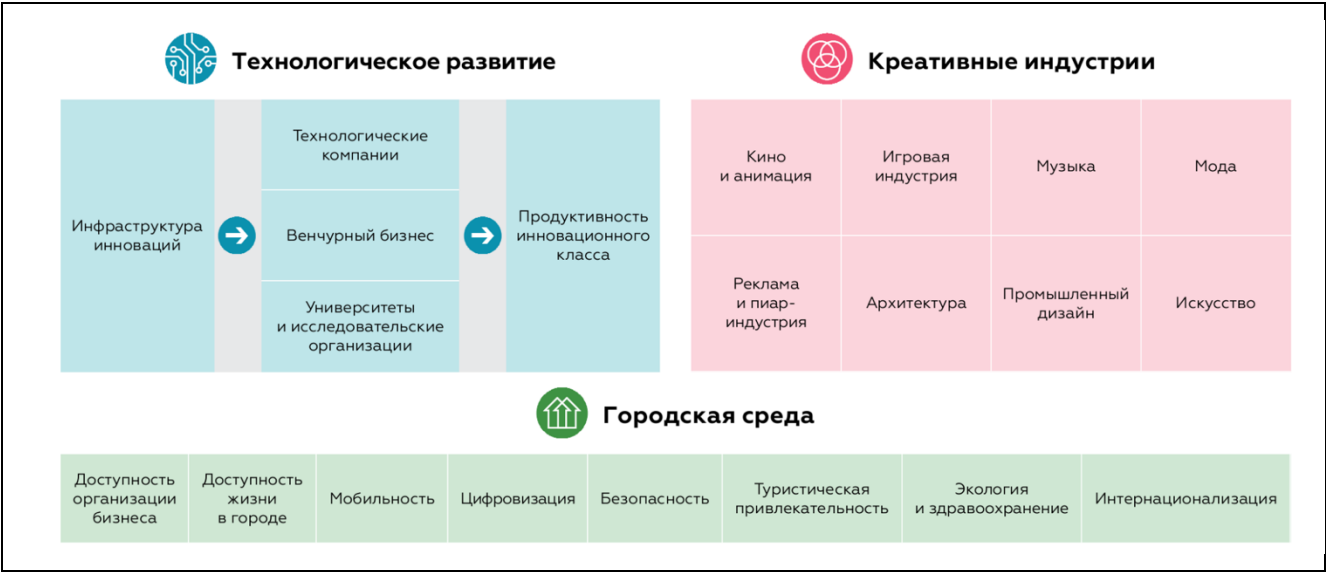
Структура рейтинга инновационной привлекательности городов 2024

227