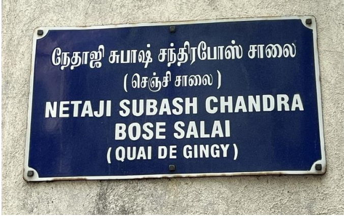
Улица Субхаса Чандра Боса (ранее – Набережная Жанжи)