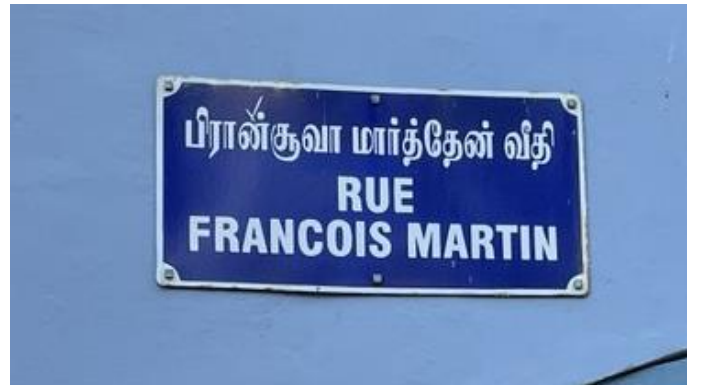
Улица Франсуа Мартена