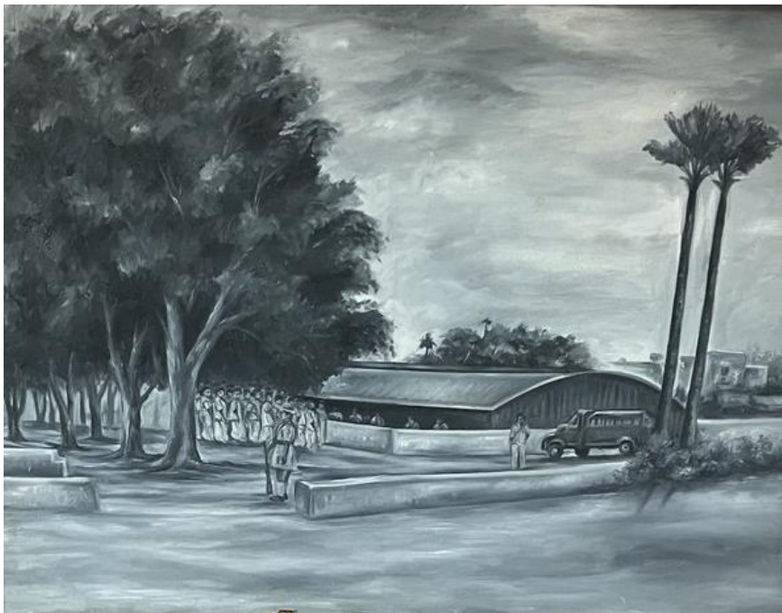
Пограничная деревня Кижур, где проходил референдум о слиянии Пондишери с Индийским Союзом, Мемориальный музей. Гравюра.