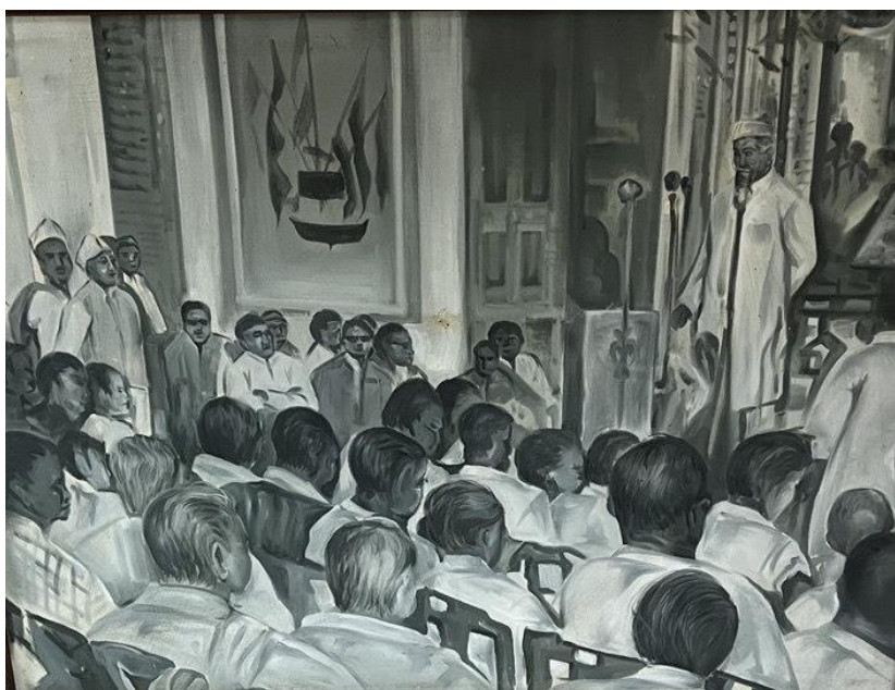
Референдум в Кижуре, Мемориальный музей. Гравюры.