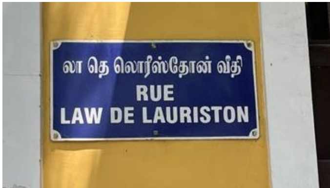
Улица Ло де Лористона