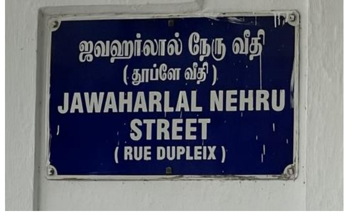
Улица Джавахарлала Неру (ранее – улица Дюпле)