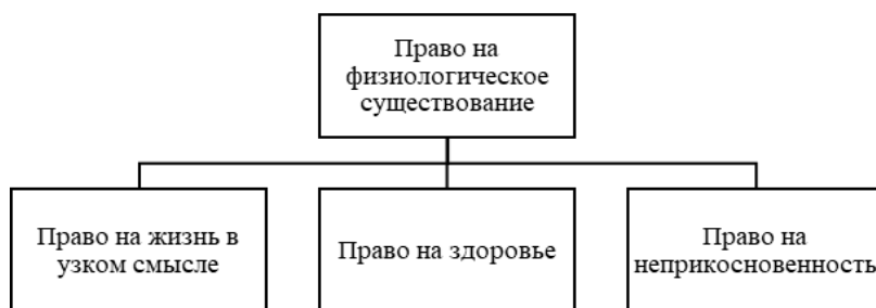
Схема 3. Содержание права на физиологическое существование

Невозможно понять сущность права на физическое существование, не разобравшись в содержании права на жизнь, права на физиологическое существование и права на социальные коммуникации, выделение которых обосновано выше как составляющие исследуемого нами сложносоставного права. Обращаем внимание на то, что право человека на физическое существование как ценность имеет многоаспектный характер, так как оно раскрывается в составляющих его правах, в частности в праве на физиологическое существование (схема 3).