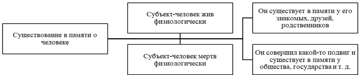
Схема 4. Существование в памяти о человеке

Исследование действующих нормативных правовых актов Российской Федерации показало, что в закреплении исторической памяти зачастую идет речь о следующей памяти: о людях, героях.