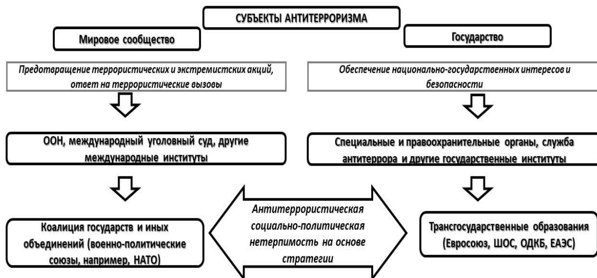
Схема 2. Система предупреждения и борьбы с терроризмом (экстремизмом)