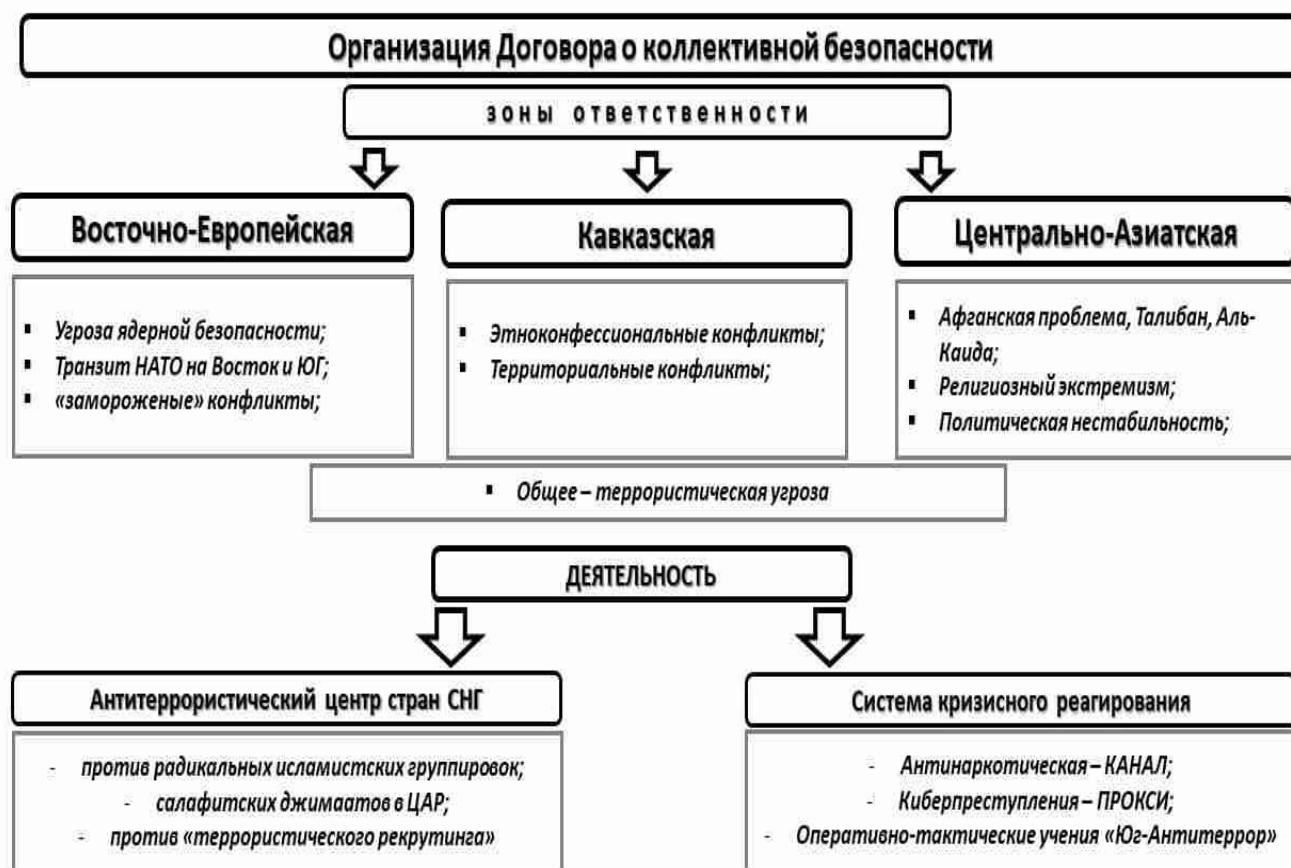
Схема 6. Система антитеррора в рамках ОДКБ

Система антитеррора в рамках ОДКБ выглядит следующим образом (см. схему № 6), при этом следует отметить, что совокупность угроз и условий по осуществлению национальной безопасности государства-члены этой организации понимают вариативно с учетом региональной специфики.