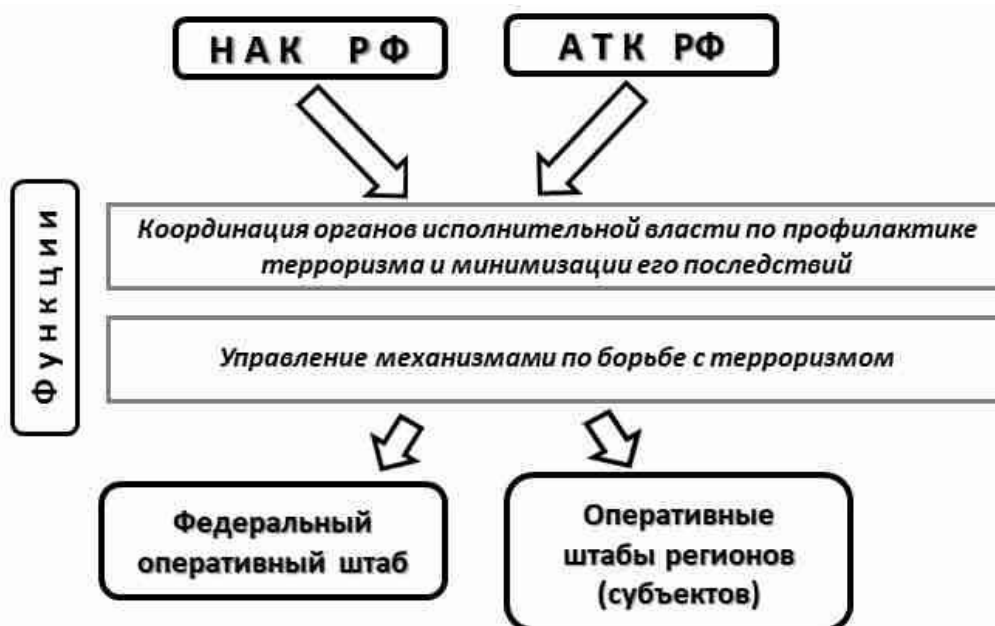
Схема 5. Взаимодействие НАК РФ и АТК РФ

Несмотря на то, что в основе формирования НАК был с очевидностью предусмотрен некий переход от исключительно силового варианта борьбы с терроризмом к системным мероприятиям противодействию ему, трудно переоценить формирование центрального штаба межведомственного взаимодействия с целью предупреждения терактов и осуществления КТО. В этой связи важным представляется завершение создания антитеррористических комиссий или их аналогов в первичном звене управления – муниципальных образованиях, особенно в нестабильных регионах страны и в городах – «миллионниках». В настоящее время создана и достаточно успешно функционирует организационно-управленческая, вертикально-интегрированная структура антитеррора в Российской Федерации (см. схему № 5).