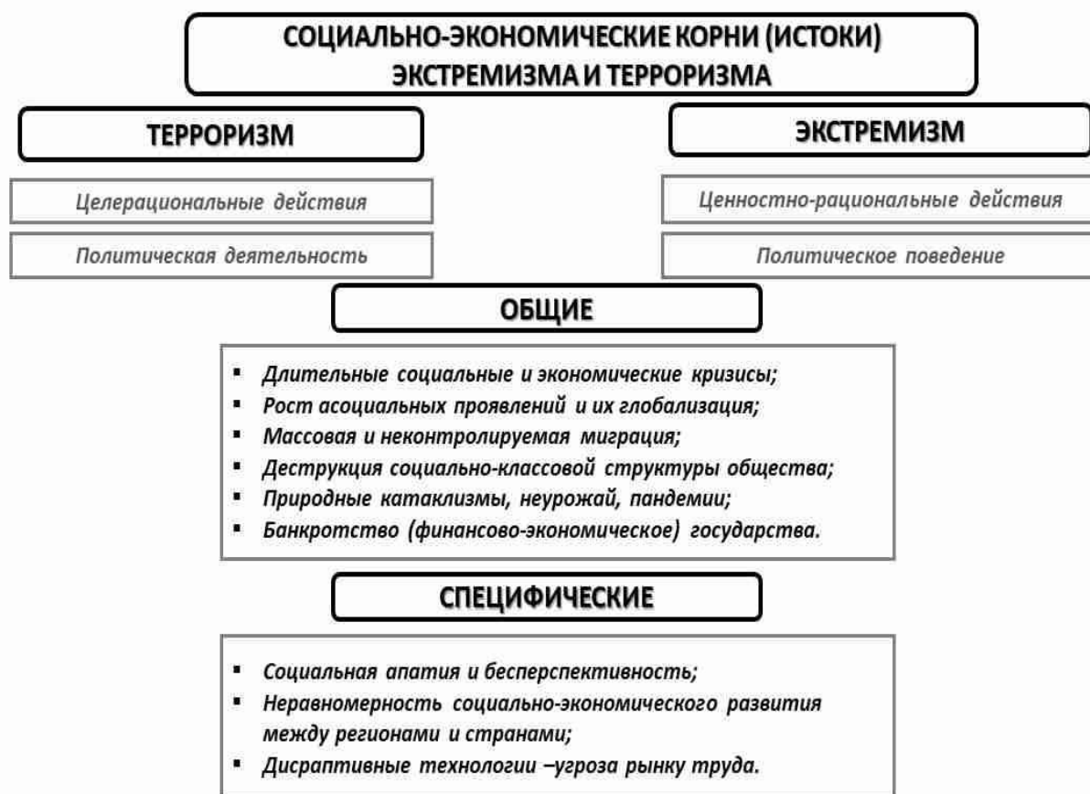
Схема 1. Социально-экономические корни (истoki) экстремизма и терроризма

Нельзя также забывать о появлении термина «государственный терроризм», который сегодня (как ярлык и инструмент угроз) угрожает широкому кругу стран, бросающих вызов гегемонии Запада. На практике политика государственного терроризма проявляется в использовании государственными органами (прежде всего разведывательными) террористических приемов и способов достижения внешнеполитических целей, например, изменения внешнеполитического или внутривнутриполитического курса того или иного государства, ослабления геополитических позиций государств-противников.