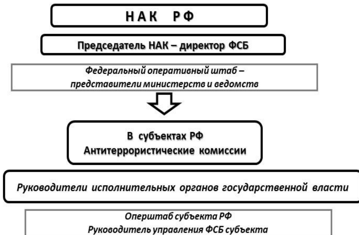
Схема 4. Структура НАК РФ

учрежден уникальный коллегиальный орган – Национальный антитеррористический комитет РФ (НАК). Эффективная деятельность НАК РФ на протяжении почти пятнадцати лет и антитеррористические успехи его функционирования подтвердили целесообразность его создания. Структура НАК РФ однозначно указывает на его функциональную спецификацию (см. схему № 4).