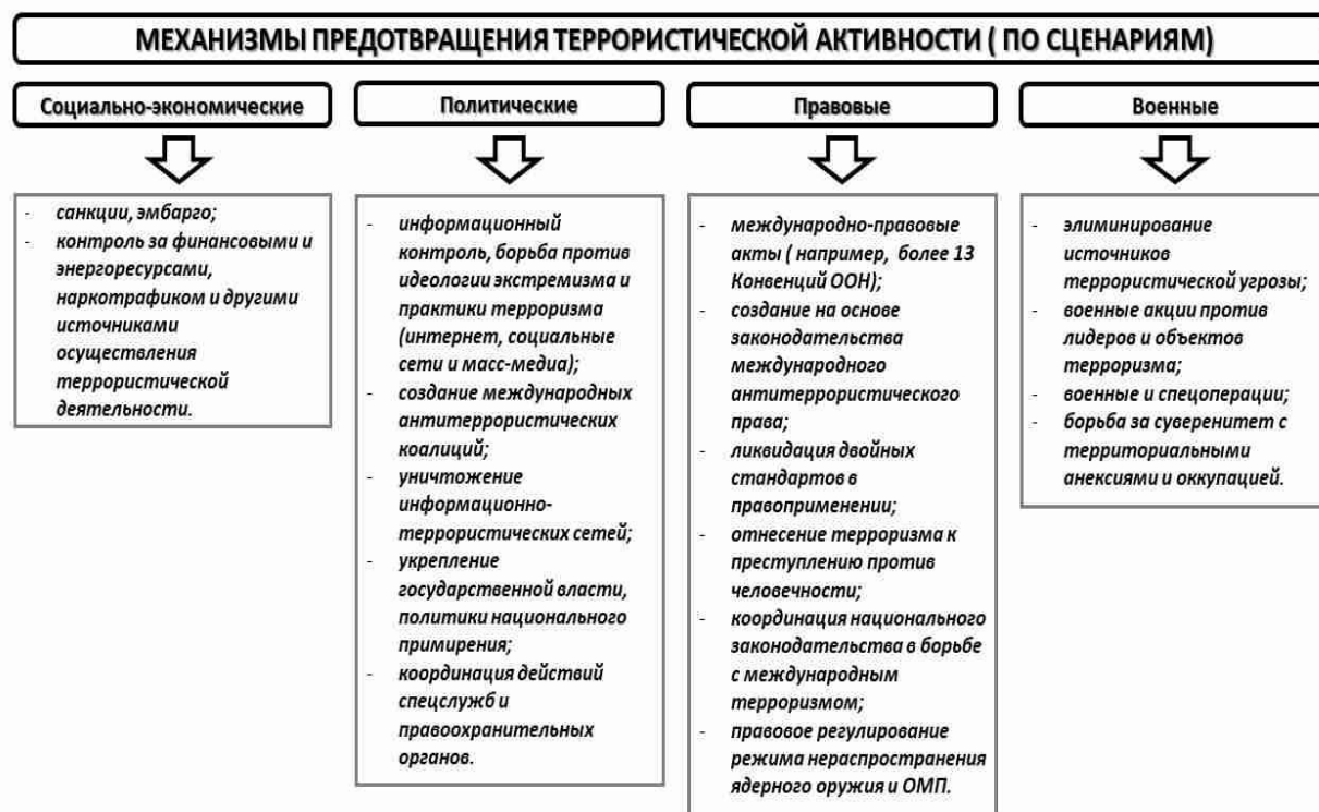
Схема 3. Механизмы предупреждения и борьбы с терроризмом (экстремизмом)