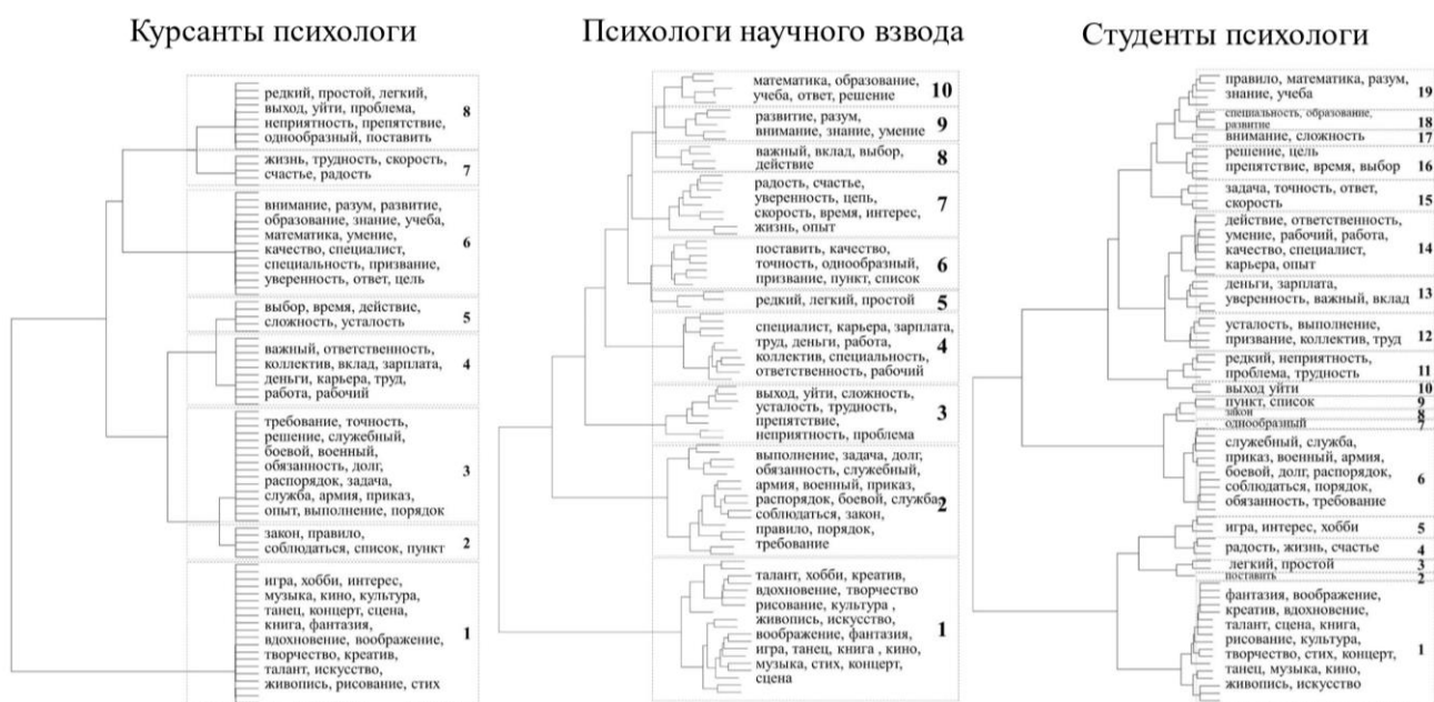
Рисунок 3. Иерархическое дерево близости, полученное на выборке курсантов-психологов, психологов научного взвода, студентов-психологов.

В результате обработки данных, полученных на трех группах респондентов, построены три матрицы близости слов друг к другу между словами. Кластерный анализ (методом Варда, мера – евклидово расстояние) позволил получить 8 кластеров для группы курсантов-психологов, 10 кластеров – для психологов научного взвода, 19 кластеров – для группы студентов-психологов (Рисунок 3).