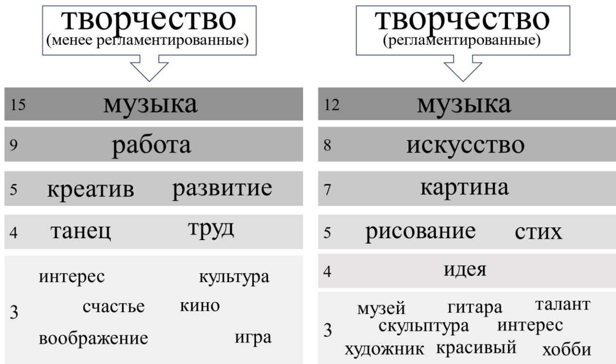
Рисунок 2. Совокупность сгенерированных респондентами ассоциаций на слово-стимул «Творчество» в группах профессионалов с разным уровнем регламентации (количество употреблений слов указано цифрами слева).

обусловлен их отношением к сфере работы. Таким образом, получен список слов-описаний, которые люди, работающие в разных сферах, могут использовать для описания определенных аспектов своей профессиональной деятельности. Всего собрано 1436 слов. Далее, при помощи количественного контент-анализа, отобраны наиболее часто упоминаемые слова (86 слов). Для содержательного анализа в выборке выделены люди, представляющие более регламентированные виды профессиональной деятельности (n=79, военнослужащие и медицинские сотрудники) и менее регламентированные виды профессиональной деятельности (n=67, артисты и музыканты), всего в 146 человек (34 женщины, 112 мужчин; средний возраст 26,6 лет; средний стаж 5,7 лет). Рассматривались семантические поля как совокупность сгенерированных ассоциаций, получившиеся вокруг слов-стимулов «творчество» для указанных групп, которые мы можем рассматривать как аналоги семантических универсалий, потому что частота встречаемости ассоциаций является неслучайной для респондентов из обеих групп (рисунок 2).