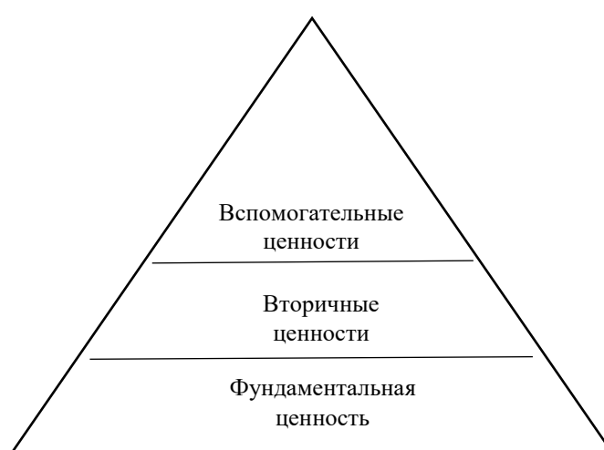
Рисунок 1. Структура идеологии (составлено автором).

Структура идеологии таким образом приобретает более иерархичный характер, несмотря на сохраняющуюся подвижность элементов структуры. Это позволяет выделить в структуре идеологии ценностные уровни, в рамках которых может происходить постоянное движение элементов, в то время как сами уровни не меняют своего положения, сохраняя иерархическую соподчиненность. Подобный взгляд на идеологию скорее соответствует образу пирамиды (рисунок 1), в то время как для описания строения идеологии по Фридену применим образ планетарной системы.