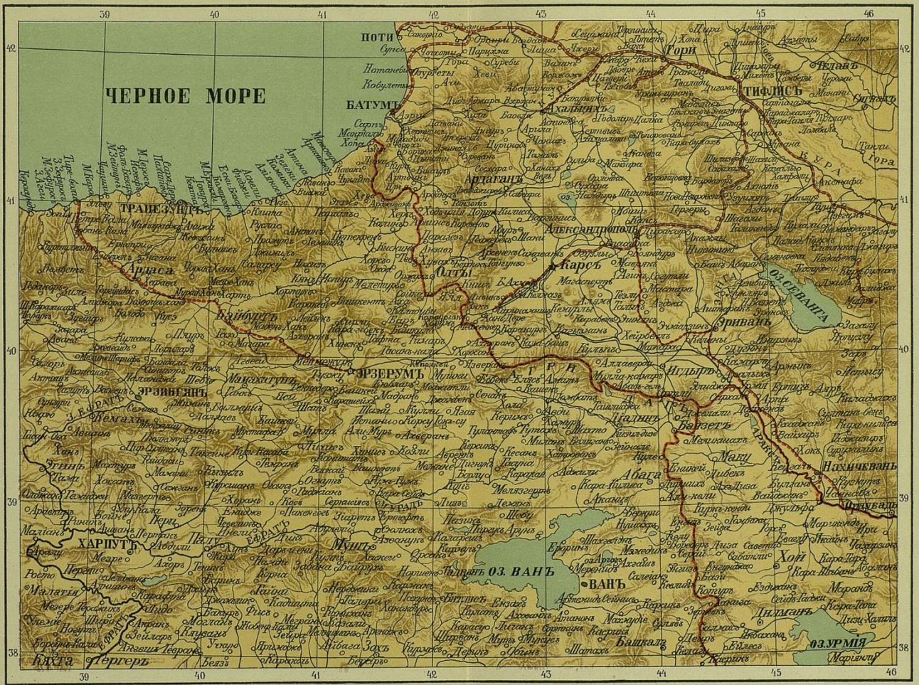
Кавказский театр военных действий.